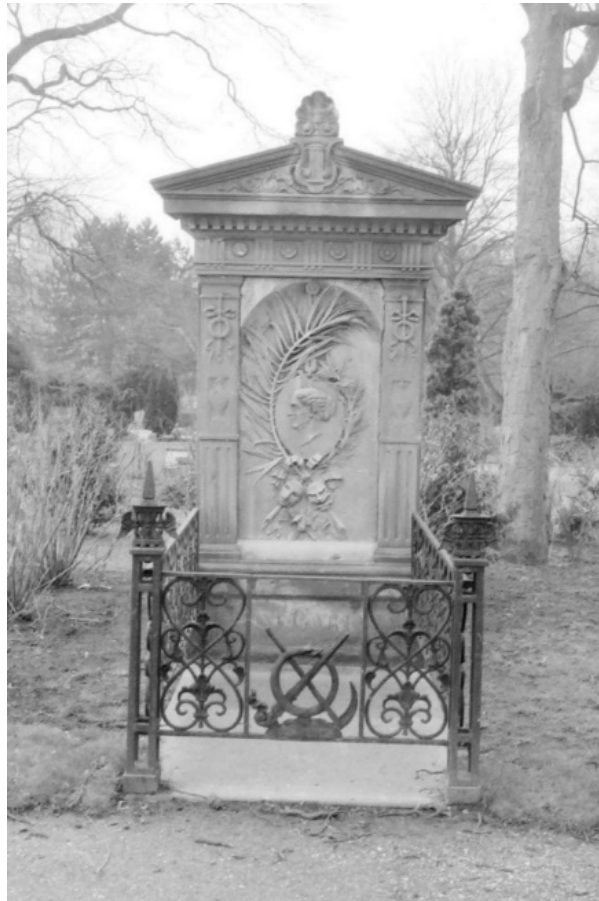
Stadsarchief Amsterdam. Grafmonument.

Naar aanleiding van de uitspraak van de Hoge Raad is met ingang van 1 januari 2010 art. 32a Wlb ingevoerd. Op grond van deze bepaling is gedurende de periode dat een graf niet mag worden geruimd art. 5:20 lid 1 onder e en f BW niet van toepassing op hetgeen op dat graf is geplaatst. Ondanks de natrekkingsregeling in Boek 5 BW blijft het grafmonument een zelfstandige zaak en blijft de oorspronkelijke eigenaar daarvan de eigenaar, hoewel het grafmonument als werk duurzaam met de grond is verenigd. De wettelijke doorbreking van de natrekking is van tijdelijke aard; zij is gekoppeld aan het bestaan van het recht op een graf (het grafrecht). Zodra de ruimingsbevoegdheid intreedt (en dat is (behoudens verlenging) bij algemene graven na ten minste tien jaar en bij particuliere graven na twintig jaar) herneemt art. 5:20 BW zijn normale werking en wordt de houder van de begraafplaats alsnog eigenaar van het grafmonument. Heel scherp zal dat omslagpunt niet te markeren zijn.