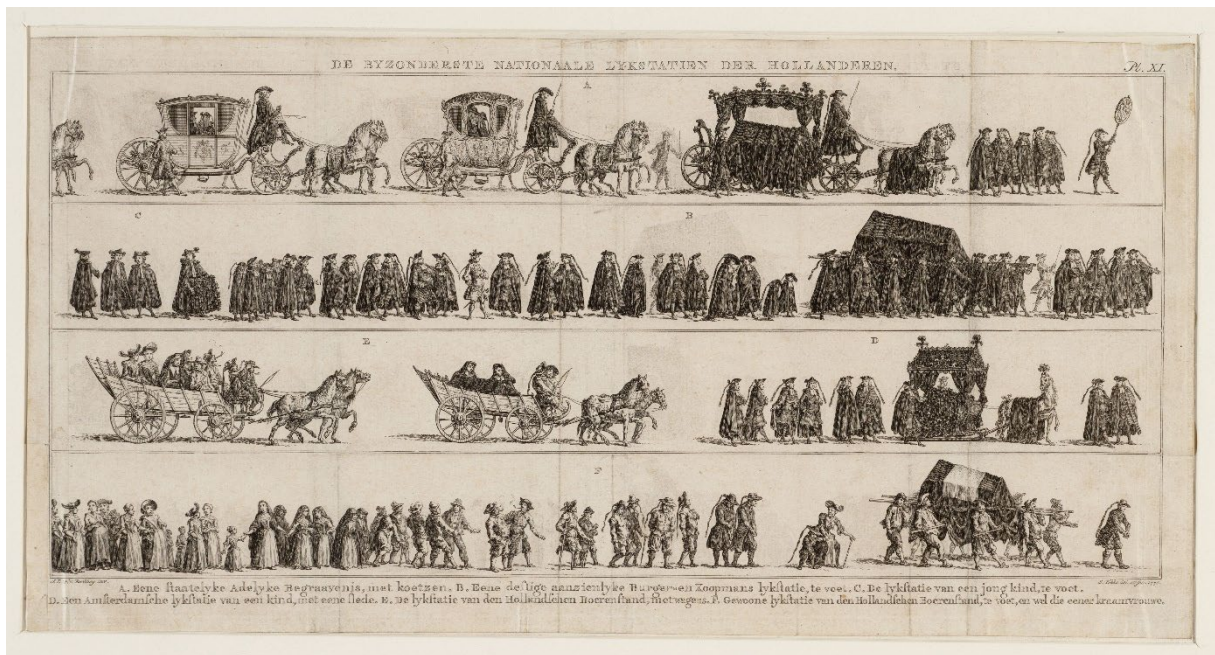
De Byzonderste Nationale Lykstatien der Hollanderen, Stadsarchief Amsterdam / Joannes le Francq van Berkhey, Simon Fokke

bovendien de volksgezondheid een belangrijke rol. Wat er met stoffelijke overschotten gebeurt, is daarom bij wet geregeld.