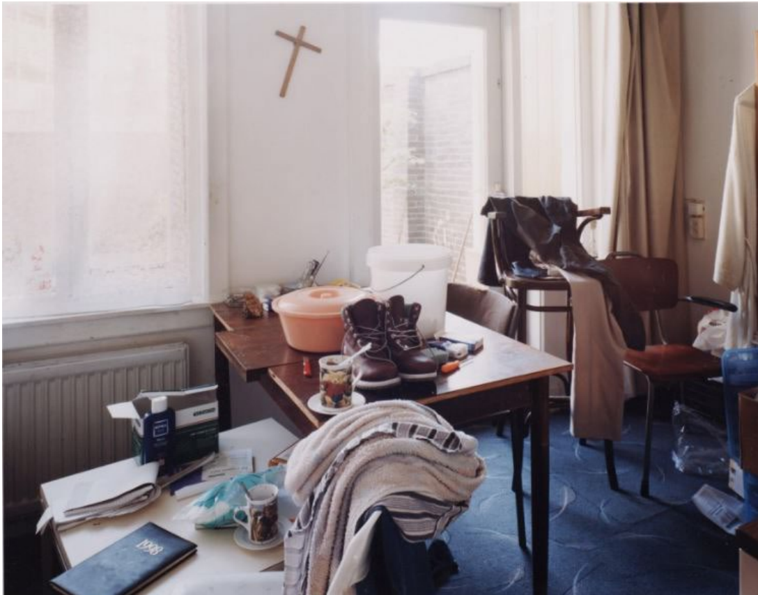
Mieke Van de Voort, foto uit de serie "In eenzaamheid overleden" (2002/2003).

Als de nabestaanden niet gevonden worden of weigeren de uitvaart te regelen, dan zal de overledene van gemeentewege begraven of gecremeerd worden. Onbekende doden zullen steeds begraven worden, waardoor er gedurende minimaal tien jaar een herkenbare plek blijft bestaan (art. 21 lid 6 Wlb).